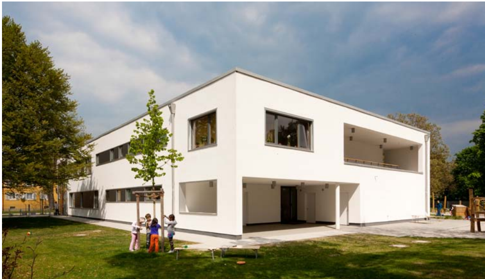
Ansicht von Südwesten